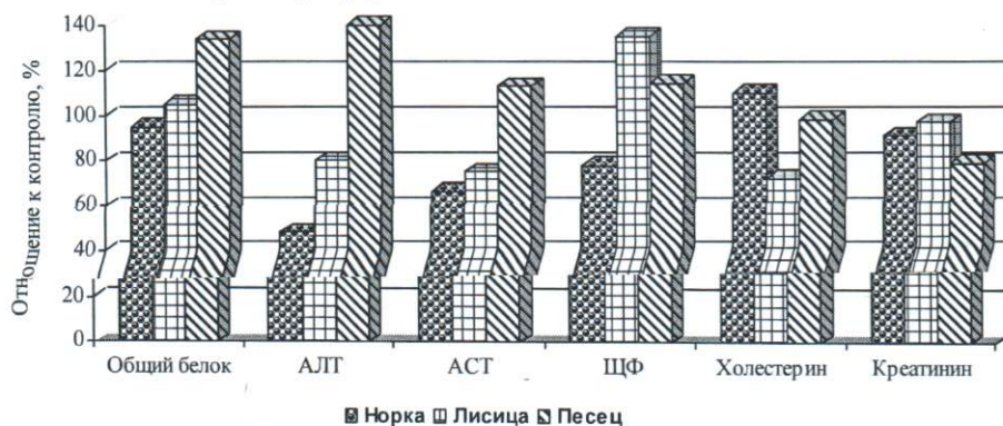
Рисунок 1 - Биохимический состав крови молодняка пушных зверей после применения лигногумата

Возможно, меньшая реакция организма песцов на введение препаратов связана с более высокой устойчивостью его гомеостаза, сформировавшейся в условиях Заполярья, в сравнении с пушными зверями средних широт [8]. Под влиянием препаратов нами зафиксировано наибольшее увеличение концентрации в крови зверей железа и магния, наименьшее – натрия и фосфора.