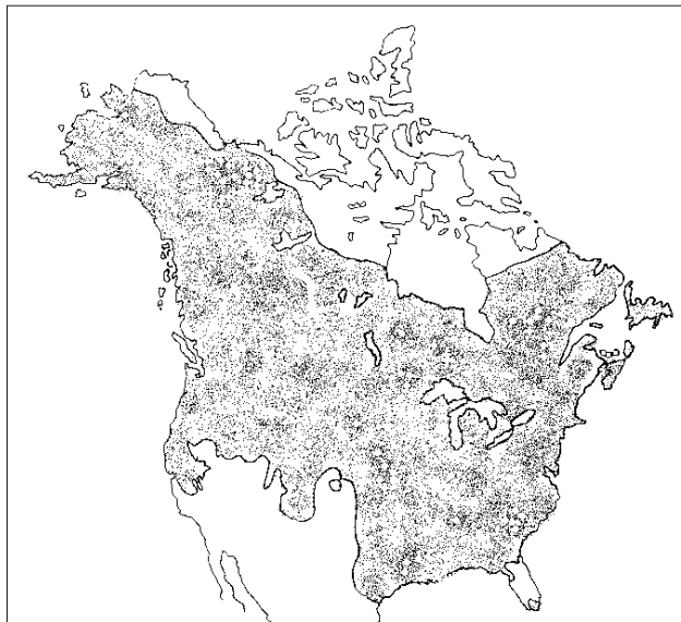
Рис. 1. Распространение норки американской в Северной Америке (Eagle, Whitman, 1987).

ся на глубину до 3 м и даже глубже. Обычны передвижения вдоль берега по суше и воде с продолжительными погружениями в водную среду. В холодный период года умело использует для перемещения подледные пустоты. Рыхлый глубокий снег заметно препятствует ее передвижению. В такой ситуации она редко отходит далеко от берегов, но в бесснежный период может удаляться от водоемов до 1 км. Населяет преимущественно узкие участки территорий вблизи различных ручьев, малых рек, озер, искусственных водоемов с развитой прибрежной древесной и кустарниковой растительностью. Иногда обитает по кромкам болот. Ледостав на мелководьях и высыхание мелких водоемов существенно отражаются на специфике территориального распределения ресурсов вида. В связи с околководным образом жизни распространение хищника в пределах ареала имеет выраженный мозаичный характер.