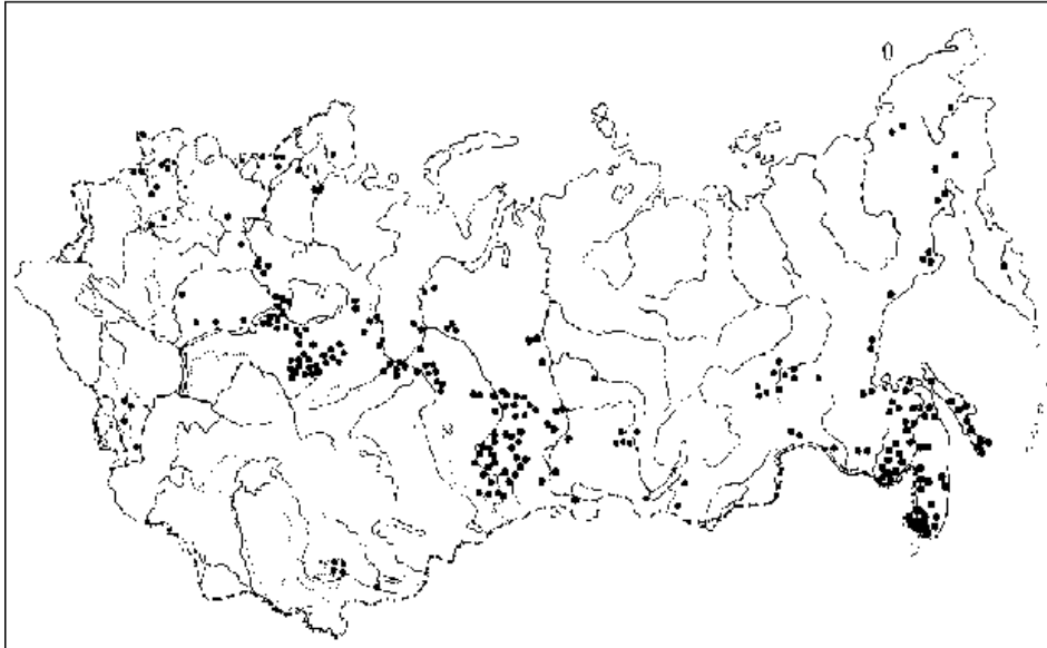
Рис. 3. Места выпусков норок американских на территории СССР (Акклиматизация..., 1973)

поголовье этих зверьков в хозяйстве достигало к осеннему периоду до 50 тыс. особей. На расположенных рядом водоемах научный сотрудник ВНИИ охотничьего хозяйства и звероводства Н.Н. Соломин отлавливал до 18 норок за сезон на 5 специально оборудованных участках. На одном из удобных для отлова участков удавалось задерживать до 6 беглецов за летне-осенний период до ледостава. Обычно побеги зверьков начинались в середине лета с начала отсадки молодняка. Не было никаких сомнений в том, что отлавливались клеточные норки. Об этом достоверно свидетельствовали окраска волосяного покрова и размеры животных. Примечательно, что среди них преобладали так называемые стандартные норки, а их цветные сородичи почему-то не были так проворны.